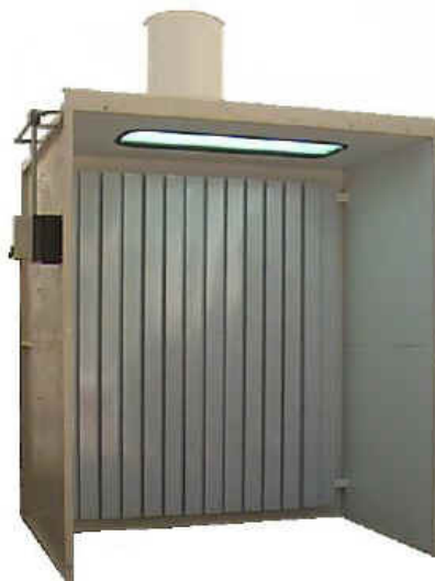
Cabine de Pintura Seca com Defletor – Modelo CSD.

A cabine de pintura com filtragem a seco tem dois modelos, que são os seguintes: