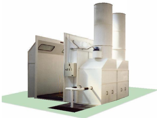
Cabine de Pintura Down-Draft - Modelo DDD

Com fluxo de ar vertical descendente com aspiração através das grades de piso montadas sobre um fosso em alvenaria, permitem a pintura de peças de grande porte e o trabalho simultâneo de dois ou mais pintores.