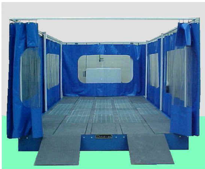
Modelos PLA-3054 e PLA-4269

Com exaustão através das grades do piso, o plano aspirante modelo PLA é utilizado na preparação e lixamento de veículos em geral e peças.