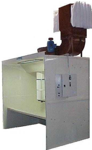
Cabine de Pintura a Pó tipo Cartucho – Modelo CCP

Cabine de pintura eletrostática a pó com filtros cartucho modelo CPP é adequada para processos de aplicação eletrostática de tinta a pó, com filtragem através de elementos do tipo cartucho de alta capacidade de retenção, ressaltando-se sua forma construtiva compacta.