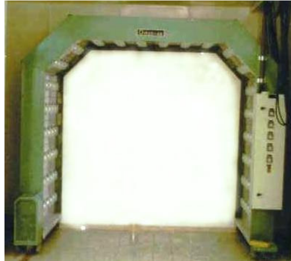
MÓDULO DE SECAGEM MODELO MSI-0760

O conjunto de lâmpadas infravermelhas idealizado para acelerar os processos de secagem/cura de tintas ou resinas, ideal para oficinas de repintura automotiva e setores de pintura em geral, principalmente em dias úmidos e chuvosos.