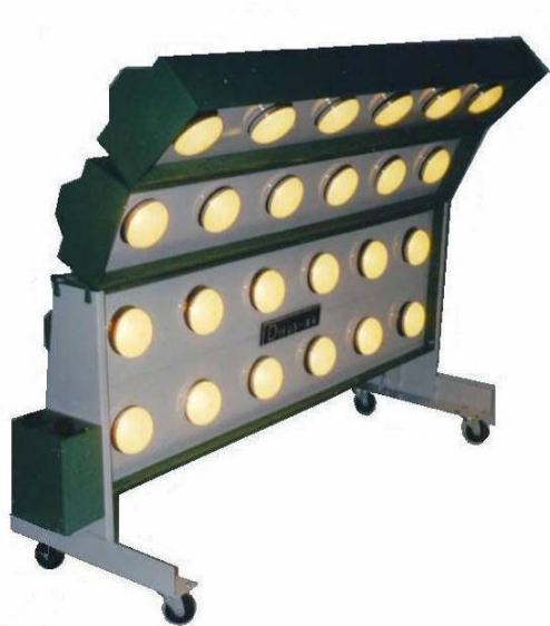
Painel de Secagem - PSI-0241